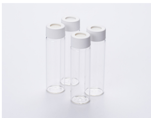
図1 保証書付きプレクリーンバイアル「TOC計用 CQバイアル」