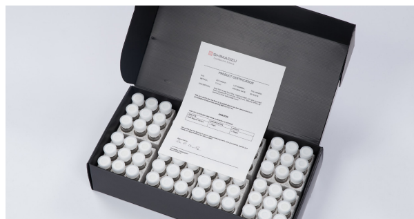
図2 CQバイアルと品質保証書

CQバイアルは、厳密な手順にしたがって製造・洗浄されています。その後、1個1個に防塵キャップが取り付けられ、埃などが出にくいプラスチック製の箱に梱包されています。製品にはロット番号がついており、バイアル内への溶出が 10 µgC/L (炭素濃度が 10 µg/L) 以下であることを宣言する品質保証書が付属しています。