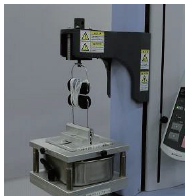
図2 試験の様子（牛乳の膜）