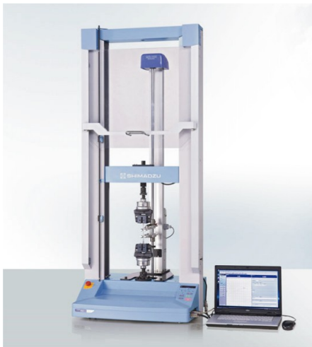
Fig.1 島津精密万能試験機 AG-X 形 外観 Overview of SHIMADZU Autograph AG-X type.

データ処理まで一貫処理が可能)「TRAPEZIUM LITE X」(Fig.2 は表示画面例)が特長です。