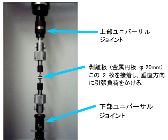
Fig.2 剥離試験治具 外観 Overview of peel test device.

試験条件は Table 1 に示すとおりで、試験力計測はロードセルにより、変位測定は試験機内蔵のクロスヘッド移動量計測機能を用いました。