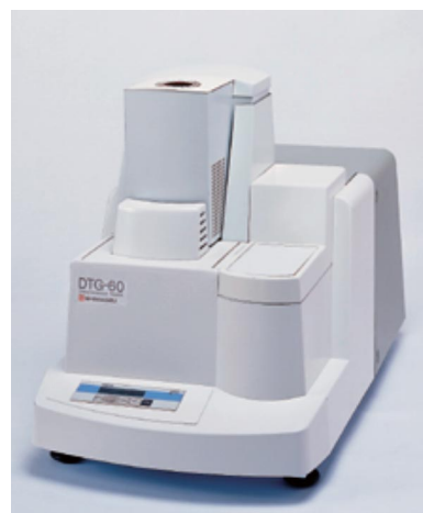
Fig.1 示差熱-熱重量同時測定装置 DTG-60/DTG-60H