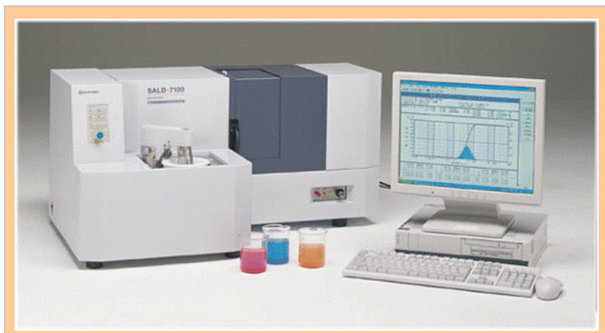
Fig.1 SALD-7100 湿式フローシステムの外観写真

今回のニュースでは、2種類のリポソームを、最新の測定装置である SALD-7100 で測定した結果をご紹介します。