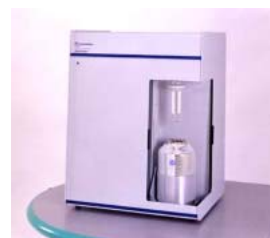
図1 トライスター 3000

3種のシリカゲルA、B、Cをトライスター3000で測定したときの細孔分布曲線を図3に示しました。また、測定値を表1にまとめました。