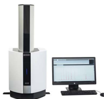
図1 卓上型 MALDI-TOF MS MALDI-8020