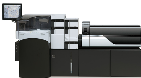
図 1 全自動前処理装置付き LC/MS/MS システム (CLAM™+LC-MS/MS)