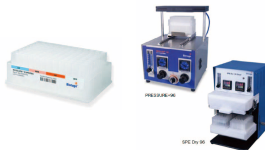
Fig. 3 Biotage EVOLUTE WCX

Biotage 社の EVOLUTE WCX は、陽イオン交換機能を主としたミックスモードによる固相抽出プレートで、攪拌や遠心分離等のオフライン作業が不要なため、短時間で簡便な前処理が可能になっています。これを用いた前処理プロトコルを Fig. 3 に示しました。