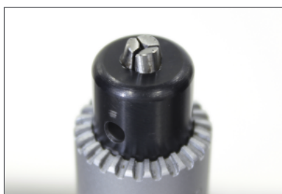
丸棒試験片用つかみ具

チャックキーを回してつかみ歯を開きます。試験片をつかみ歯の間に入れ、取付ハンドルを用いてつかみ歯を閉じます。