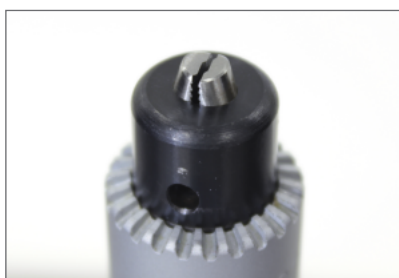
平板試験片用つかみ具