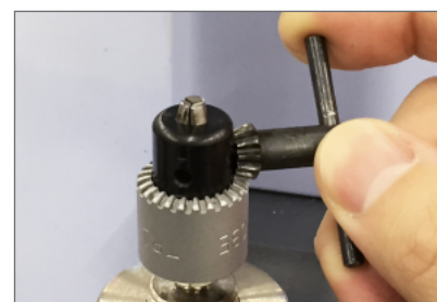
取付ハンドルによる締め付け