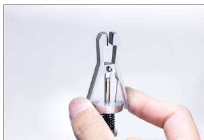
クリップによる操作

上部／下部つかみ具のつかみ歯は、左右のレバーを用いて操作します。左右のレバーはそれぞれのつかみ歯にリンクしています。試験片の取り付けは、左右のレバーを同時に押し、開いたつかみ歯の間に試験片を入れ、レバーをゆっくりと放すと試験片が把持されます。つかみ歯のレバーに張力を与えるばねの長さを変えることで、把持力の調節が可能です。