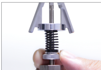
把持力の調節ねじ