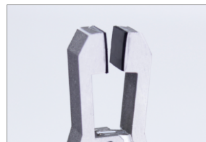
ラバーコートつかみ歯