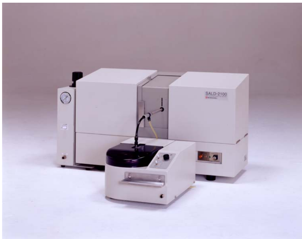
Fig.1 SALD-2100 乾式測定システム

Fig.1は SALD-2100 に乾式測定システム SALD-DS21 を接続した外観写真です。測定部本体の手前にあるのが SALD-DS21 です。SALD-DS21 ユニットは、従来型のターンテーブル方式での試料搬送に加えて、任意の試料容器から試料を吸引することのできるハンドショット方式と、極少量試料に対応可能なワンショット方式の3つの試料搬送方式が用意されています。今回の測定ではターンテーブル方式を採用しました。