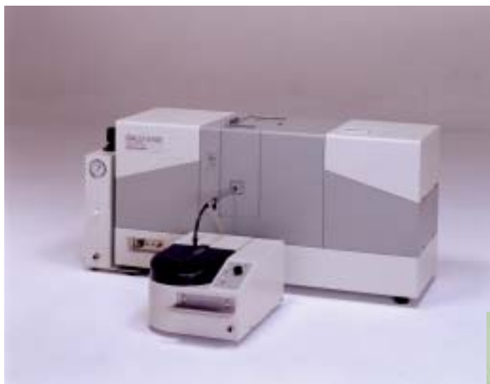
Fig.1 SALD-3100 乾式測定システム全景

Fig.2 はハンドショットシステムを使用して、実際に試料を吸引し測定している様子です。