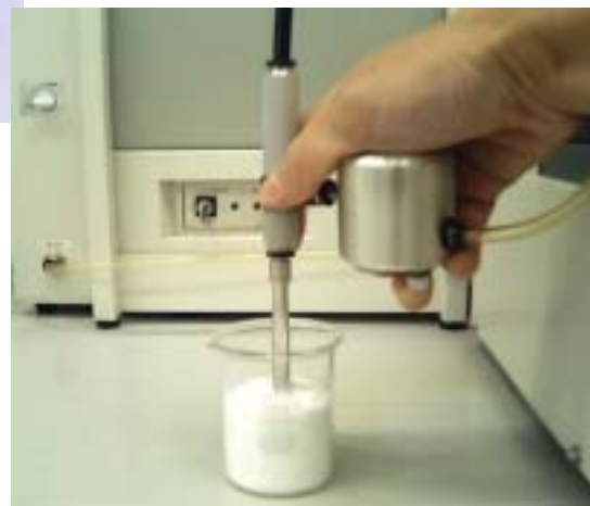
Fig.2 ハンドショットシステム