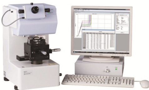
Fig.3 微小圧縮試験機 MCT 形 外観 Overview of micro compression testing system.

このデータからは、口腔内でブラッシングすることにより粒子が容易に破碎され、前述のような研磨効果が期待できるものと考えられます。