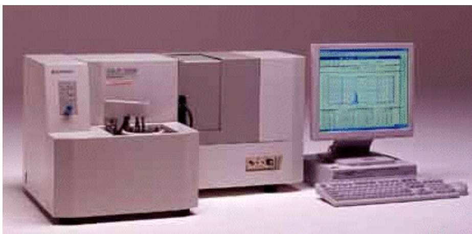
Fig.1 粒度分布測定装置 SALD-2200 形 外観 Overview of Particle size distribution analyzer.

これを見ると[すり潰し前]の分布曲線上 200 \mu\text{m} 付近に存在するピークが造粒研磨剤粒子と推測されますが、[すり潰し後]はこのピークが 100 \mu\text{m} 付近に移動していること、また 3~4 \mu\text{m} 付近の分布量が増えていることが読取れます。これは造粒粒子が解砕された結果、微粒子の分布量が増加したことを示しています。(すなわち、造粒前の一次粒子の大きさは 3~4 \mu\text{m} 付近を中心とした粒子径分布を持っていたものと考えられます)