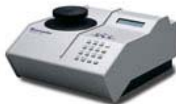
Fig.2 アキュピック 1330

実際の発泡プラスチックではこれら2種類の気泡が混在しているのが普通です。開放気泡の割合（もしくは独立気泡の割合）は、発泡プラスチックの絶縁性、断熱性、強度、防水性などを評価する上で非常に重要です。