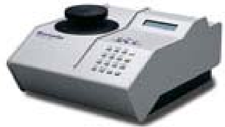
Fig.1 アキュピック 1330

物性の評価にはよく密度が使われますが密度と言っても空隙を含まない真密度、閉孔を含む粒子密度、そして細孔も試料の一部とみなしてしまう Envelope 密度といろいろあります。アキュピックではこの内の粒子密度を測定することができます。もちろん、その試料に閉孔がなければ真密度が測れていることになります。このアキュピック 1330 シリーズでは実際には体積のみの測定になります。そしてあらかじめ量っておいた質量を入力することで密度が計算されます。