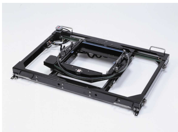
Fig.2 オートXYステージ Automatic X-Y Stage

また自動多点測定が可能であることから、深紫外測定においても、窒素パーズを破ることなく測定ができますので便利な付属装置となります。オートXYステージ測定では透過測定・反射測定どちらも可能です。