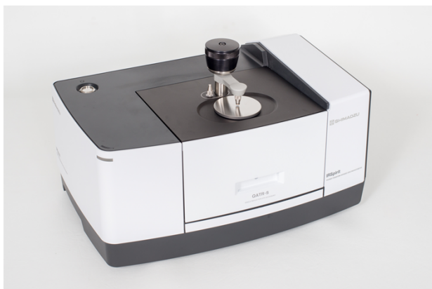
図1 IRSpirit™+ QATR™-Sの外観

FTIRは、試料に赤外線を照射して得られる赤外スペクトルを利用して化合物を定性・定量します。簡便で迅速にスペクトル測定ができるため、試料の確認試験に最適です。測定には、IRSpirit-Tに1回反射ATR測定装置QATR™-Sを付属したシステムを使用しました。図1に装置外観を示します。IRSpiritはA3サイズ以下の小さなボディで、簡単に持ち運びが可能です。