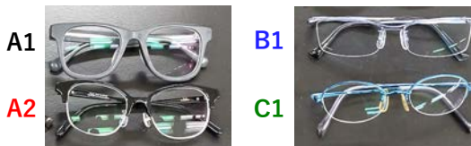
図1 測定した眼鏡レンズの外観

図1に、測定に使用した眼鏡を示します。同一メーカーの眼鏡は同じアルファベットで示しています。また、図2にはマルチパーパス大型試料室MPC-2600Aへの眼鏡レンズ設置例を、表1には測定条件を示します。実際の着用時には目と眼鏡の位置関係が多少変動することを考慮し、眼鏡レンズを毎回設置し直して3回測定を行いました。