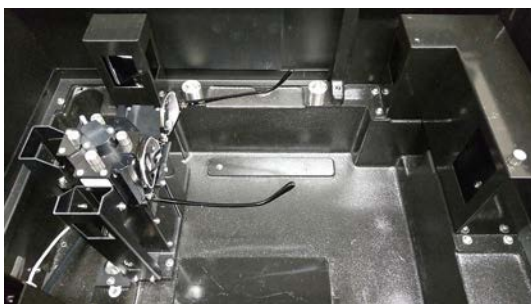
図2 MPC-2600Aへの眼鏡レンズ設置例