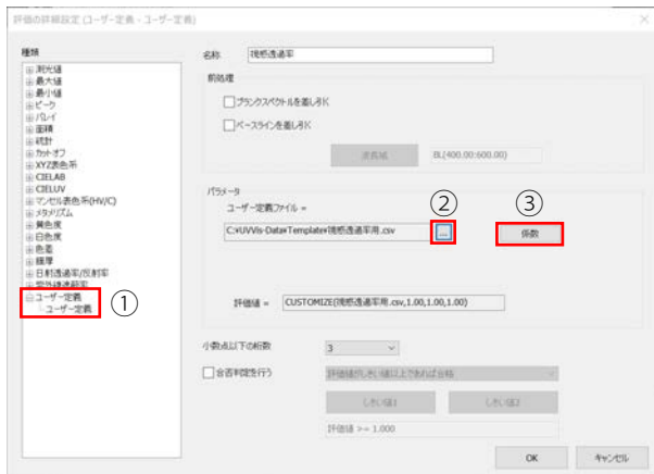
図5 スペクトル評価機能におけるユーザー定義設定画面

図5には、LabSolutions UV-Visのスペクトル評価機能において、ユーザー定義（図5の①）を選択した場合の設定画面を示します。ユーザー定義では、目的に応じた任意の重係数を設定し、測光値との積和計算を行うことができます。評価値を求める計算式は式(1)で表され、重係数を用いて加重平均した値が算出されます。