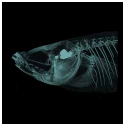
Fig.2 メダカの CT による 3 次元画像 An example of 3-dimensional CT image for killifish

Fig.2 は、観察対象を撮影した CT 画像をもとにして 3 次元的なイメージを再構成して表示したものであり、骨格の構造を大変詳細に見ることができます。