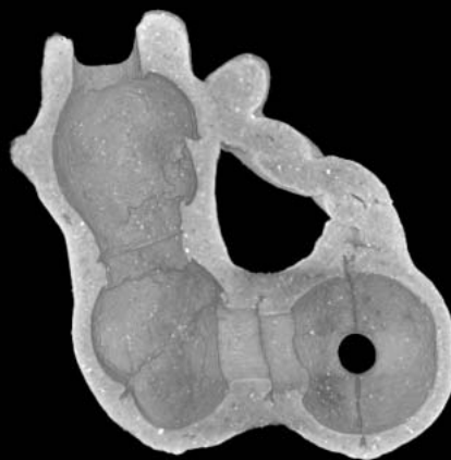
図4 3D画像(図3手前外殻を除去したもの)