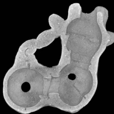
図6 3D画像(図5手前外殻を除去したもの)

以上のように、SMX-225CT を使用すると出土物の内部を破壊することなしに観察することができます。また、ここでは紹介しませんでした、内側の見たい部分を立体的に表示することも可能です。このように SMX-225CT の機能を駆使することで、今までにない新しい側面からの観察が可能になります。