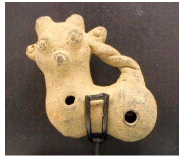
図2 遺跡出土品外観

使用した SMX-225CT (図1) は、100 万画素の検出器を搭載しており、直径約 140mm × 高さ約 100mm の空間が観察できる範囲になります。