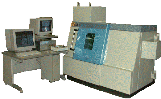
図1 SMX-225CT 装置外観

遺跡などから発掘された出土品は非破壊で調査することが必要です。このため出土品などの文化財の研究では、非破壊で内部を観察することができるX線観察装置が重要なツールになってきています。ここでは、島津マイクロフォーカスX線CTシステムSMX-225CTを用いて遺跡出土品を観察した例を紹介します。