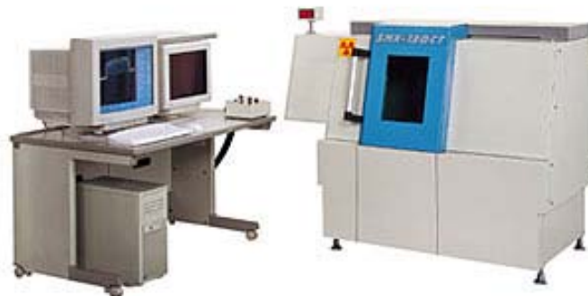
図1 SMX 100CT装置外観

ここでは粉粒体層(充填状態)の内部状態を、極めて高い分解能を持つ『島津マイクロフォーカスX線CTシステム SMX-100CT』(図1)で観察した例をご紹介します。