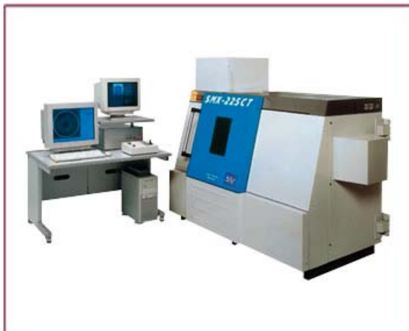
図 1 SMX-225CT-SV3 の外観

島津マイクロフォーカス X 線 CT システムは、医療用 X 線 CT 装置と基本的に同じ原理で断面や 3 次元画像を得ることのできる装置です。特に、このシステムではマイクロフォーカスと呼ばれる微小焦点線源から照射される X 線によって、高分解能の詳細な内部情報を非破壊で得ることができます。今回は樹脂で作られた人形を例にして、マイクロフォーカス X 線 CT システム SMX-225CT-SV3 (図 1) による、断面画像や 3 次元画像がどのようなものかを示してみました。