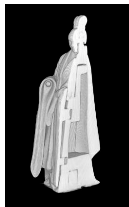
図3：図2を側面カットした3次元画像 (図2の向って右側を断面カットしました)