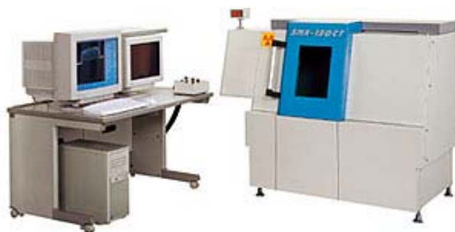
図1 SMX 100CT装置外観

試料は有機系の顆粒を内蔵したゼラチンのカプセルで、図2に全体像をCT撮影した画像を示します。図3にはこのカプセルのMPR (Multi-Planner-Reconstruction) 画像を示しています。