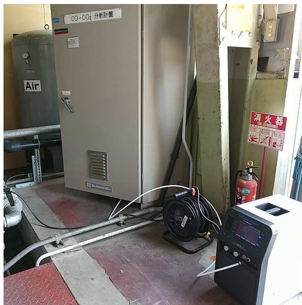
図5 CGT-7100による浸炭炉の雰囲気測定の様子

本稿でご紹介した浸炭炉のほか、各種雰囲気炉、グローブボックス、材料試験用雰囲気制御チャンバーのように空間内雰囲気のガス濃度測定が求められる場面に島津ポータブルガス濃度測定装置をお役立てください。