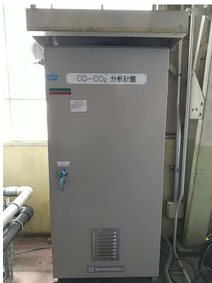
図2 島津連続ガス濃度測定装置NSA-308