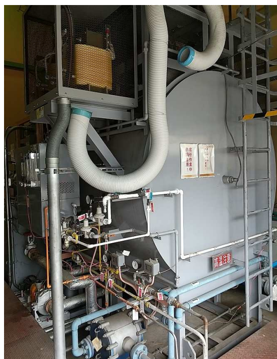
図1 滴注式ガス浸炭炉

浸炭炉に隣接して設置されたNSA-308の試料前処理部のフィルタ出口にCGT-7100のサンプリング配管(外径8mm×内径6mm PTFEチューブ)を接続し、CGT-7100内蔵ポンプでサンプリングしました(図3)。測定条件を表1に示しました。