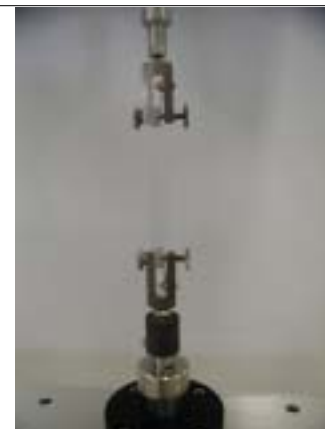
写真2 細線試料と治具全景