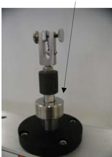
写真3 試験治具とロードセル