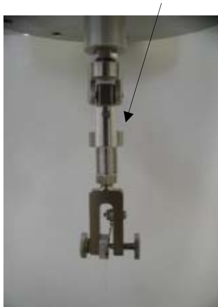
写真4 試験治具と十字ピン

疲労試験の負荷は試料の受ける応力を制御します。試料に負荷される応力が正弦波形状となるように応力の山と谷の値、並びに負荷周波数を設定して実施します。下図の実施例(図1)では上応力、下応力がそれぞれ800MPa(4N)、100MPa.(0.5N)、負荷周波数は10Hzです。