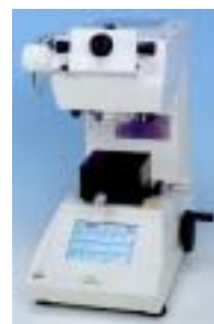
図1 HMV 外観