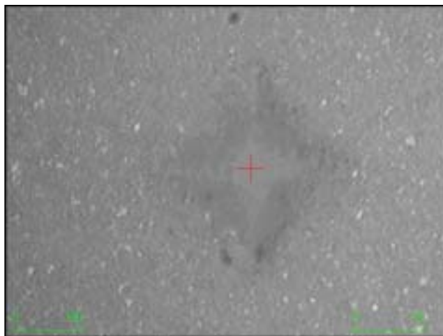
図2 くぼみ画像（試験面塗布なし）

図2 に示すとおり、くぼみと周辺部とのコントラストが悪く、くぼみ対角線長さの測定が不可能です。