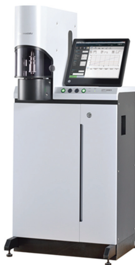
図1 フローテスタ CFT-EX