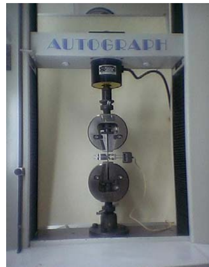
Fig.1 オートグラフによる引張試験 Static tensile test by SHIMADZU AUTOGRAPH

負荷速度はクロスヘッド速度5mm/minで、途中まで伸び計を使用して標点間のひずみを測定し、その後伸び計を取り外し破断まで負荷をしました。