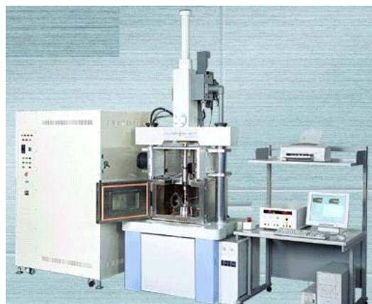
Fig.3 高速引張試験機 HITS-T 外観 Overview of high-speed testing system HITS-T

負荷速度は 6000mm/secとし、高速負荷のため機械的な伸び計を装着できないので、ひずみゲージを試験片に貼付して測定器の限界である 30000 \mu ( 3 \times 10^{-2} )までのひずみを計測しながら、破断まで負荷を行いました。