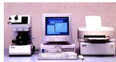
図1 DUH-W201S 外観図