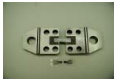
図5 小型試料用特形掴み具