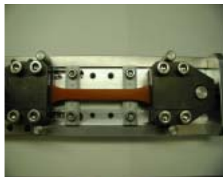
図2 試料と試験治具

この試験で得られた試験力と応力の時間変化グラフ（図3）ならびに試験力のサイクル変化グラフ（図4）を示します。まず図3から、試験力の大きさが試験機定格値(20kN)に対して 300/20000 ~ 100/20000 という低域であるにもかかわらず正確な応答波形が得られていることがわかります。また、図4から、試験力制御の長時間安定性も良く、この試験機が小容量負荷試験に適していることがわかります。図4のサイクル数1からサイクル数30にかけての立ち上がりは、負荷振幅の漸増機能により滑らかに所定試験力に到達していることを示しています。これらは20ビットデジタルサーボ制御によって得られる高性能制御技術によります。