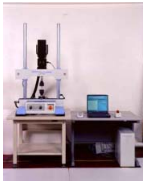
図 1 LM20 k N 形疲労試験機