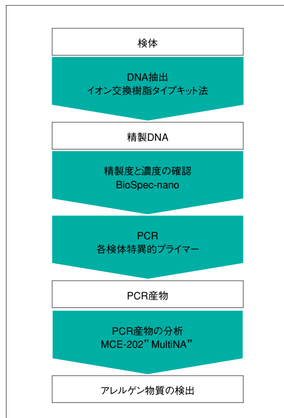
Fig. 1 アレルゲン物質の検出手順 Experimental Procedure of Detection of Allergen Materials