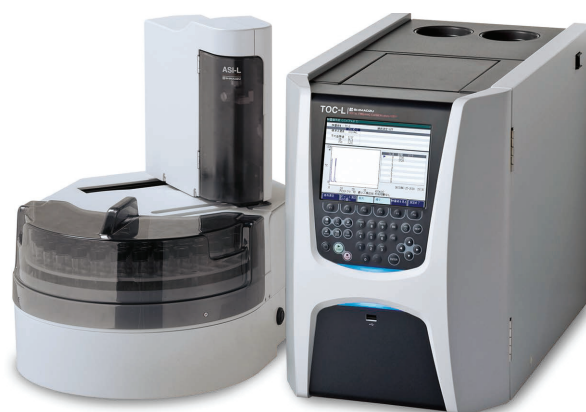
Fig. 3 島津全有機体炭素計 TOC-L Shimadzu Total Organic Carbon Analyzer TOC-L

このように TOC 計を使用して WSOC 濃度を算出することができ、PM 2.5 の発生源調査やディーゼルエンジンの研究などに活用することができます。