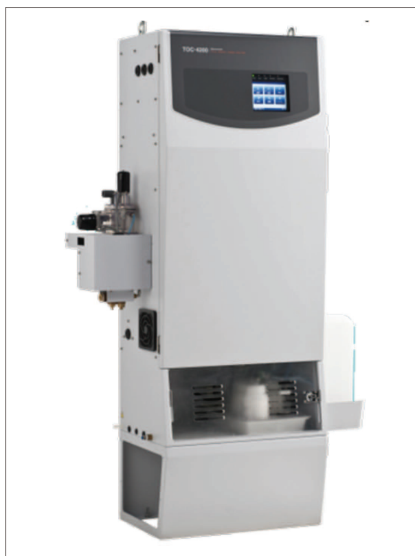
Fig. 3 島津オンライン TOC 計 TOC-4200 (単流路懸濁試料前処理器付き) SHIMADZU Online TOC Analyzer TOC-4200 with Single Stream Suspended Solids Sampling Unit