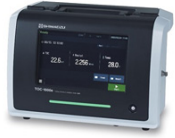
▶ eTOCシリーズ 純水用オンライン TOC計 TOC-1000e