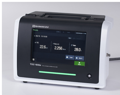
図 1 TOC-1000e