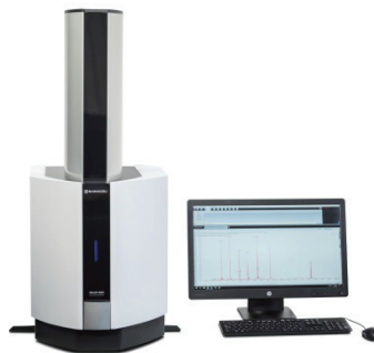
図 2 卓上型マトリックス支援レーザー脱離イオン化飛行時間型質量分析計 MALDI-8020

これら応用例では、配列特異性と生物学的な安定性を兼ね備えた PNA が、高い選択性を持つ分子プローブとして一塩基変異やこれと関連する遺伝疾患などの「ほとんど同じだがほんの一部だけ異なる配列」を見分けるのに使われています。また、PNA はヒト免疫不全ウイルス (エイズウイルス; HIV-1) 治療のためのアンチセンス薬としての応用可能性があるとも言われています。