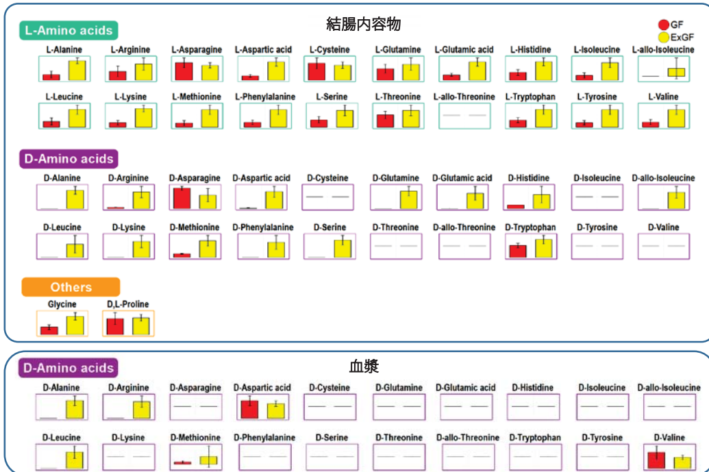
図4 結腸内容物および血漿中の D,L-アミノ酸濃度 (赤 : GF 黄 : Ex-GF)