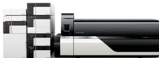
図 2 LC/MS/MS メソッドパッケージ DL アミノ酸 および Nexera™ X2+LCMS™-8060 システム