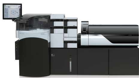
図 1 全自動前処理装置付き LC/MS/MS システム (CLAM™+LC/MS/MS)