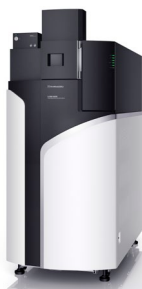
図1 DPiMS™ QTとLCMS™-9030の外観図

本アプリケーションでは、ヒト全血中の薬物のスクリーニングを目的とした、探針エレクトロスプレーイオン化キットDPiMS QTと四重極飛行時間型質量分析計LCMS-9030 (図1) を組み合わせた新しい分析手法を紹介します。DPiMS QTでは、探針エレクトロスプレーイオン化法 (Probe Electro Spray Ionization: PESI) を採用しており、前処理から分析にかかる時間を最小限に抑えた直接分析が可能です。また、新規開発の測定手法 iDIA を使用することで、イオン化された全成分について、網羅的にMS/MSスペクトルを取得することができます。