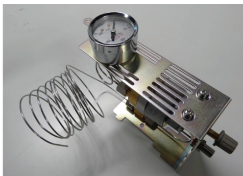
パージ用マニュアルフローコントローラー