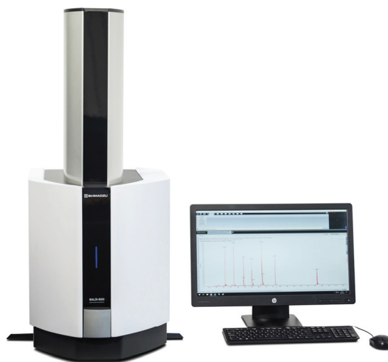
図 1 卓上型 MALDI-TOF MS MALDI-8020

このように、MALDI-8020 のリニアモードの分解能、質量精度等は、従来の MALDI-TOF MS の同じモードと比べてなんら劣るものではないことが示されています。