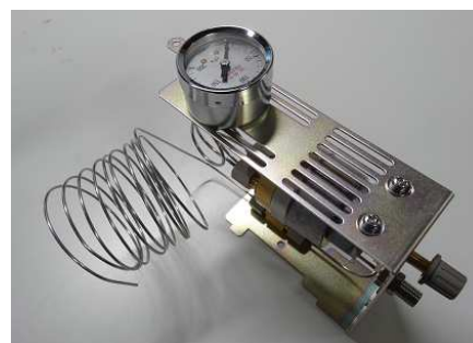
パージ用マニュアルフローコントローラー