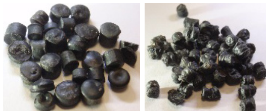
図2 （左）未使用 （右）使用済

測定試料は、図2に示す未使用と使用済のプラスチックペレットです。使用済は元の形が崩れ、表面の凹凸が大きくなっています。