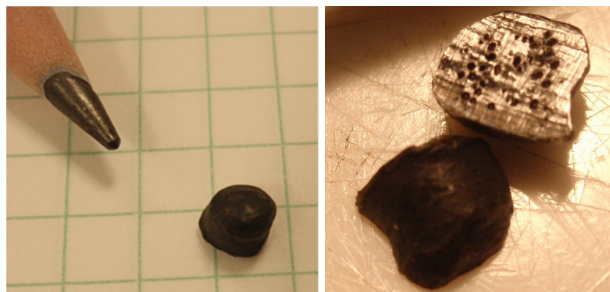
図1 （左）5 mm 程度のプラスチックペレット（右）断面の様子

プラスチックペレットは、図1（左）に示すように、大きさは5 mm 程度です。また、図1（右）に示すように、断面を観察すると多数の細孔が確認できます。