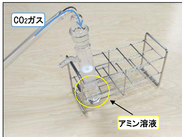
図1 アミン溶液へのCO 2 吸収実験の様子

今回はこれら2種類のアミン溶液に、図1のようにCO 2 を流し吸収させて試料を準備しました。