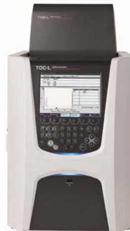
図2 島津全有機体炭素計TOC-Lと全窒素測定ユニットTNM-L