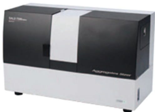
Fig. 1 バイオ医薬品凝集性評価システム「Aggregates Sizer」 Aggregation Analysis System for Biopharmaceuticals “Aggregates Sizer”