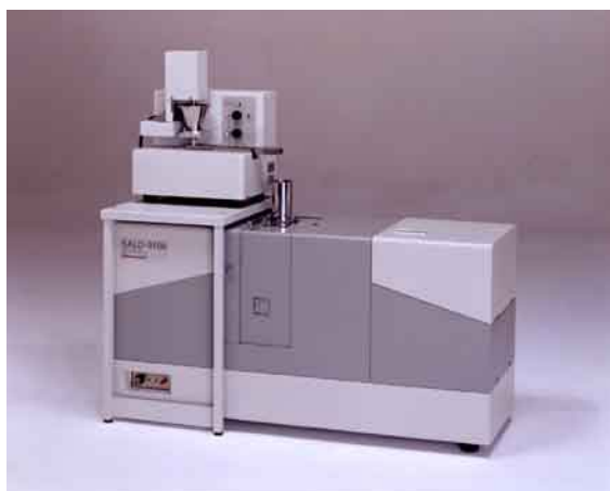
Fig.1 SALD-3100 自由落下型乾式測定システム SALD-3100 Free-fall type Dry Measurement System

今回のニュースでは、洗濯用粉末洗剤を SALD-3100 自由落下型乾式測定システム（レーザ回折式粒度分布測定装置 SALD-3100 + 自由落下型乾式測定ユニット SALD-DS3）で測定した例をご紹介します。Fig.1 に装置の外観写真を、Fig.2 に装置の内部構造を表す概略図を示します。