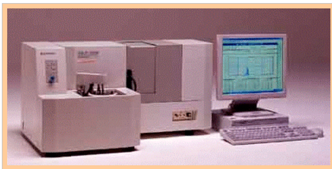
Fig.1 SALD-2200 湿式フローシステムの外観写真

今回のニュースでは、SALD-2200 による粒度分布測定例をご紹介すると共に、従来機種の SALD-2100 で同一試料を測定した結果をご紹介します。