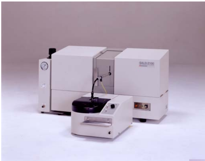
Fig.1 SALD-2100 乾式測定システム全景

Fig.1 は SALD-2100 に乾式測定システム SALD-DS21 を接続した外観写真です。測定部本体の手前にあるのが SALD-DS21 です。SALD-DS21 ユニットの、従来型のターンテーブル方式での試料搬送に加えて、任意の試料容器から試料を吸引することのできるハンドショット方式と、極少量試料に対応可能なワンショット方式の3つの試料搬送方式が用意されています。