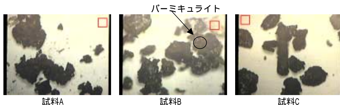
Fig.2 顕微鏡写真 ( は一辺が50 μm )

また、試料Aおよび試料Bの再現性は良く、試料Cは良くありません。目視するといずれの試料にも保水剤であるパーミキュライト (Fig.2 試料B参照) が含まれていますが、特に試料CにはFig.2の画面に入り切らない大きな塊状パーミキュライトが存在しました。パーミキュライトの真密度は約2.2~2.7g/cm 3 であり、測定試料の真密度のバラツキは試料に塊状パーミキュライトが存在するかしないかが原因です。一方パーミキュライトの比表面積は数m 2 /gで、試料の比表面積値を大きくする要因ではありません。試料Cの比表面積値が大きい原因は鉄粉が微粉であるか比表面積の大きい添加物 (活性炭) が多く含まれていることが考えられます。