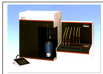
GEMINI & フローフレップ

使い捨てカイロの主成分は鉄粉です。化学反応を早めるための触媒や酸素をより多く吸収するために活性炭なども添加されています。この添加率が使い捨てカイロのノウハウになります。鉄は微粉にすることで空気中の酸素との接触面積が増大し、添加物がさらに化学反応を促進します。