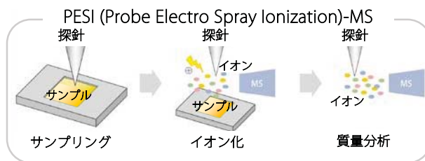
図1 DPiMS™-2020と探針エレクトロスプレーイオン化法の原理 サンプルプレート上の試料に探針を刺し、探針表面に付着したサンプルに電圧をかけることで分子をイオン化する。